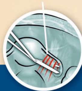
Премахване на срастванията