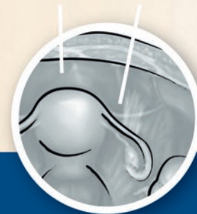
Зараснала тъкан без сраствания на мястото на приложение на гела